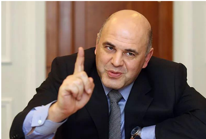
Михаил Мишустин Руководитель ФНС РФ