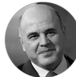
Михаил Мишустин Руководитель ФНС РФ

Ключевой принцип в контрольной работе – начинать проверку только в тех случаях, когда инструментами предиктивной аналитики выявлены схемы уклонения от уплаты налогов.