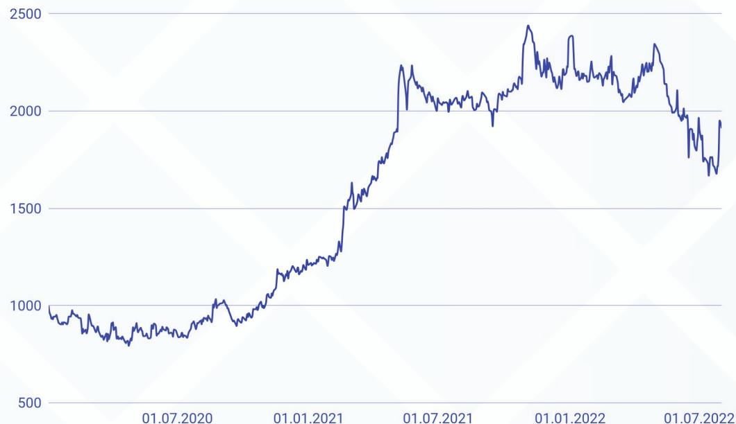
Динамика изменения значения EQRE Blue Index на 01.08.2022