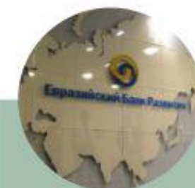
Евразийский банк развития $120 млн