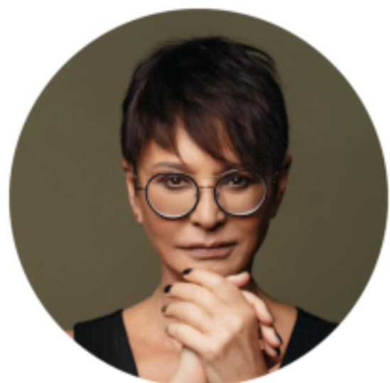
Ирина Хакамада бизнес-тренер