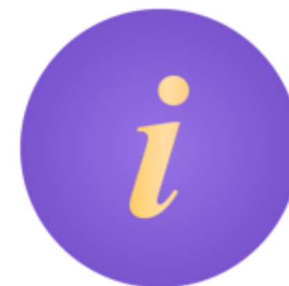
2. Кризис избыточного информационного поля