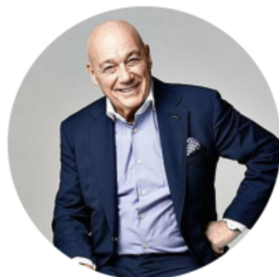
Владимир Позднер журналистика